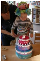
Er is er één jarig!