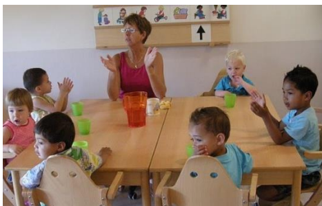
Dan is er tijd voor een liedje.