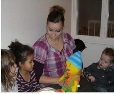
Puk praat tegen ons en hij begrijpt ons.