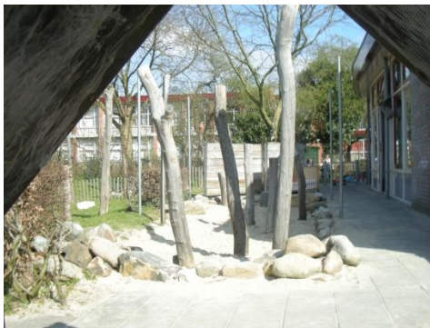
Buiten kunnen de kinderen heerlijk spelen.