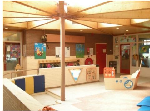
Veiligheid voor alles, maar natuurlijk ook gezelligheid!