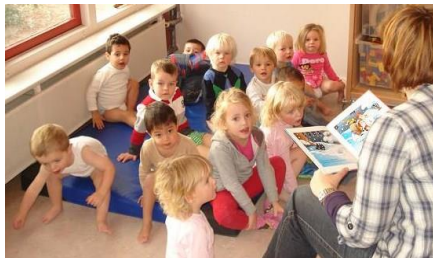
Kleertjes uit, pyjamaatjes aan. De hoogste tijd om naar bed toe te gaan.