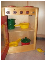
Peuters zijn graag in de weer met potten en pannen.