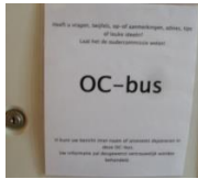
Natuurlijk is er ruimte voor medezeggenschap, daarvoor hebben wij de oudercommissie.