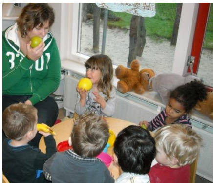
Opvoeden is imiteren.