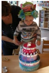
Er is er één jarig!