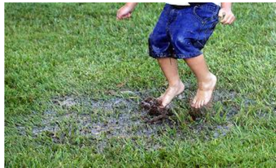
Lekker spelen in de modder. Gezond voor kinderen!