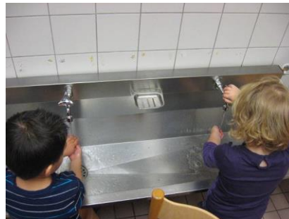
Handen wassen hoort er gewoon bij.