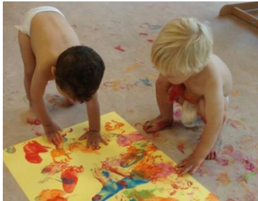
Wat doet verf en hoe voelt het?