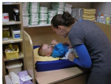
Moment van persoonlijke aandacht,