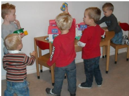
Spelen is rekening leren houden met elkaar.