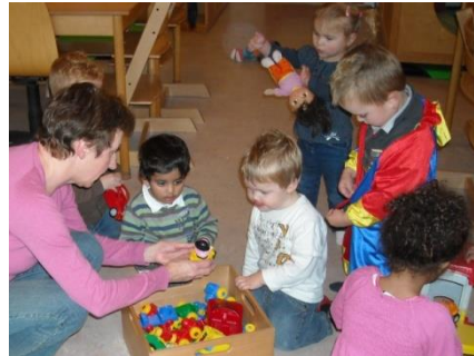
Opvoeden is het begeleiden van samen spelen, samen delen.