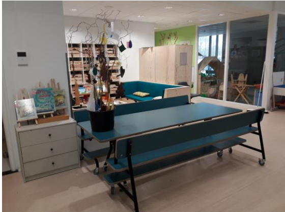
Groepsruimte/ leerplein Jong Boogschutters.