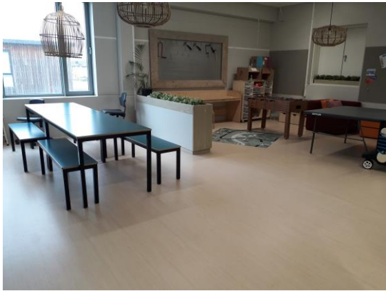
Groepsruimte oud Watermannen.