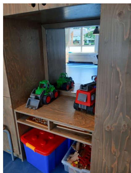
Speelgoed en een heerlijke grote spiegel!