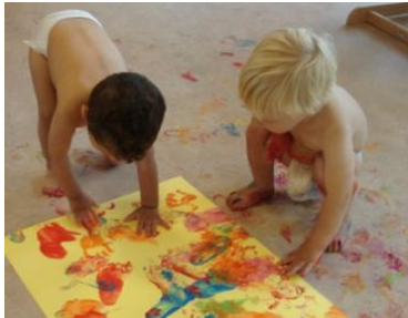
Wat doet verf en hoe voelt het?