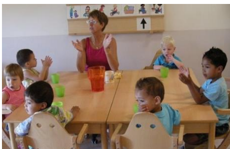
Dan is er tijd voor een liedje.