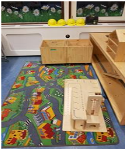
In de speelzaal