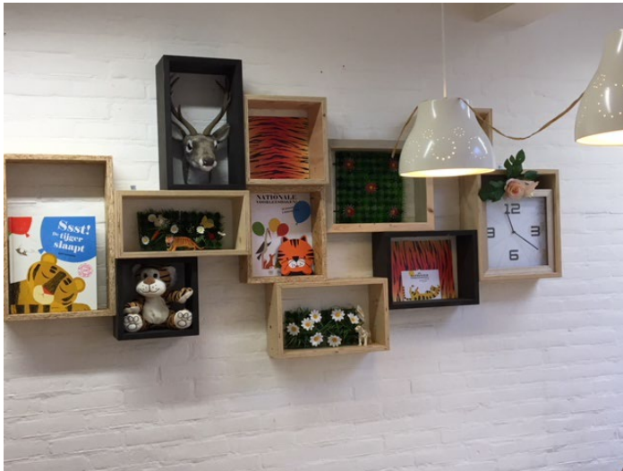
Thema 'Ssst! De tijger slaapt'

Soms maken wij een uitstapje met de kinderen. Bijvoorbeeld naar de kinderboerderij, een brief posten of iets dergelijks. Wanneer wij een uitstapje doen met de kinderen, vragen wij hiervoor toestemming aan de ouders. Over het algemeen is dit ook al tijdens het kennismakingsgesprek aan de orde geweest.