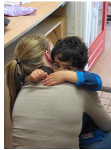
Opvoeden is soms troosten.