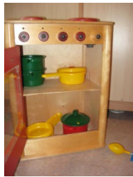
Peuters zijn graag in de weer met potten en pannen.