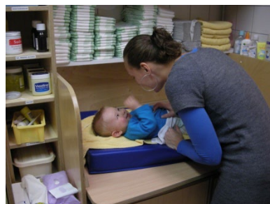
Moment van persoonlijke aandacht,