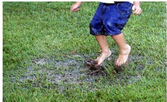
Lekker spelen in de modder. Gezond voor kinderen!