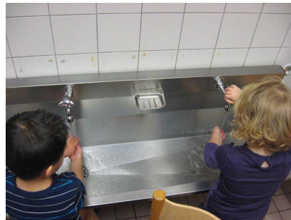
Handen wassen hoort er gewoon bij.