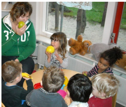
Opvoeden is imiteren.