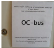
Natuurlijk is er ruimte voor medezeggenschap, daarvoor hebben wij de oudercommissie.