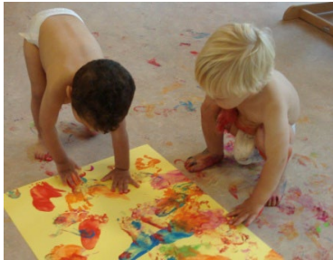
Wat doet verf en hoe voelt het?