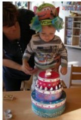
Er is er één jarig!