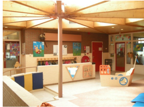
Veiligheid voor alles, maar natuurlijk ook gezelligheid!