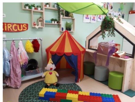
Thema hoek/ tafel