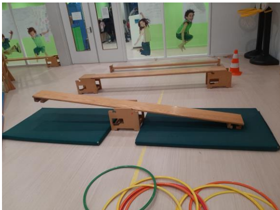
Lekker bewegen in het gymlokaal