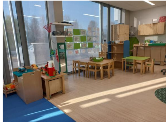
Veel (mooi) natuurlijk licht inval, mooie ruime groepsruimte