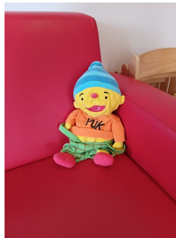
Puk doet altijd mee op de peutergroep