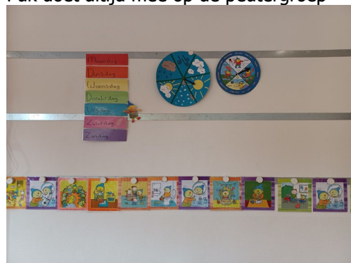
Dagritme kaarten, dagen van de week, het weer en het seizoen zijn onderdeel van onze kring bij de peutergroep.