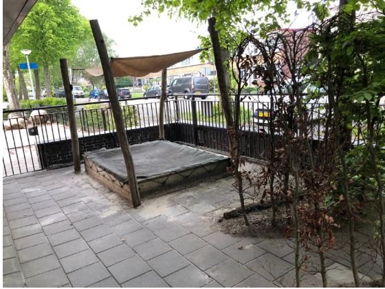
Buitenspelen in ons aangrenzende speelterrein