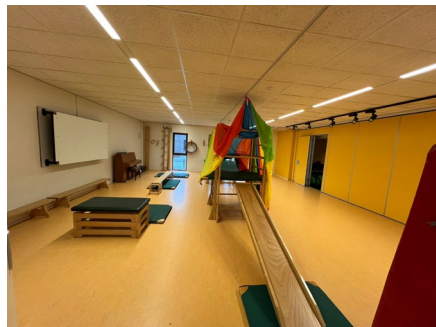
Elke week hebben we peutergym in de gymzaal van de Kors Breijerschool