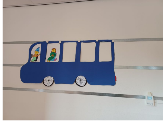
Activiteiten en thema's altijd zichtbaar aan de muur