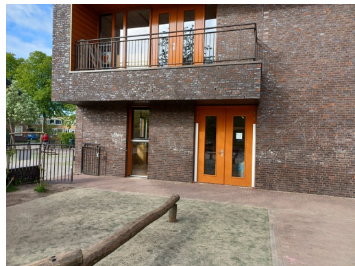
Ingang van de peutergroep