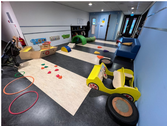
De centrale hal waar de kinderen samen kunnen spelen.