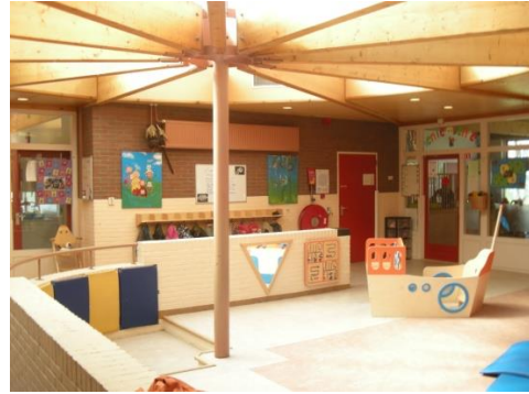
Veiligheid voor alles, maar natuurlijk ook gezelligheid!