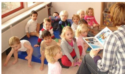
Kleertjes uit, pyjamaatjes aan. De hoogste tijd om naar bed toe te gaan.