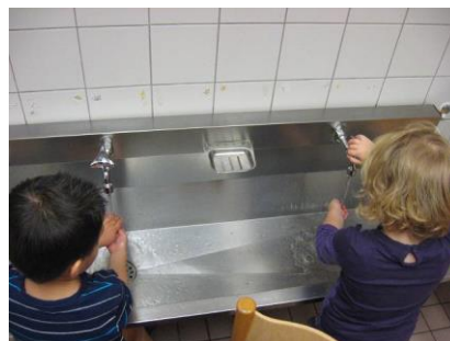
Handen wassen hoort er gewoon bij.