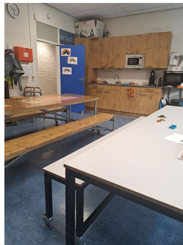
Een blik naar de keuken