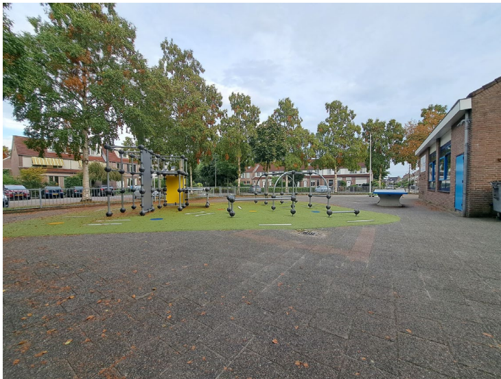
Buiten bij de hoofdingang van het schoolgebouw