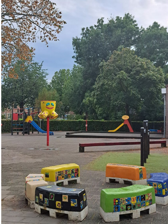
Buiten bij de kleuterafdeling