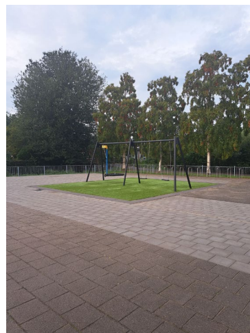
Buiten, naast de BSO