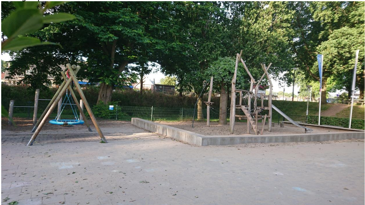
Buiten kunnen de kinderen heerlijk spelen.