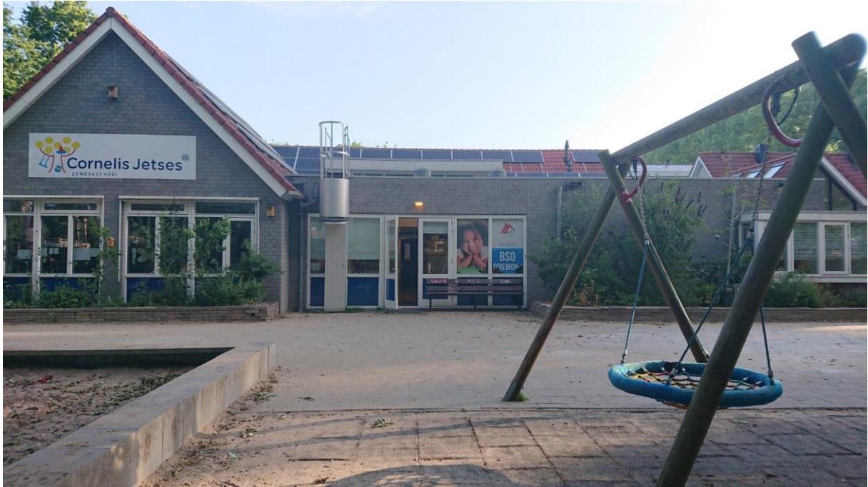
Welkom bij onze BSO